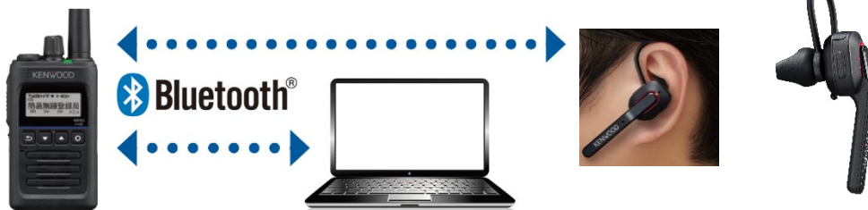
<ワイヤレスヘッドセット「KHS-55BT」（別売オプション）>

※4：メモリーコントロールプログラム「MCP-10B」（当社ケンウッドブランド公式ホームページから無償ダウンロード）が必要です。